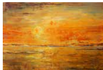
Sonnenuntergang Öl auf Leinwand, 120 x 80 cm