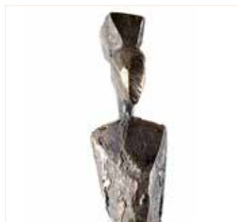
Grace Jones Bronze, 50 cm