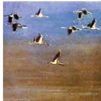
Kranichflug Farbradierung, 50 x 65 cm