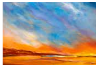
Horizont Öl auf Leinwand, 40 x 40 cm

... wurde in Sambia geboren und lebt seit 1991 in Caputh. Sie begann mit der Malerei an einer Staffelei in der Kalahari. Ihre erste Auszeichnung gewann sie als ersten Preis für ihre Gemälde in Öl beim nationalen Kunstwettbewerb Botswanas. Bis heute sind ihre Werke geprägt von ihrer afrikanischen Heimat.