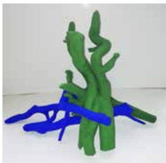
Erde und Wasser Efeuzweige mit Acryl, 47 x 19 x 30 cm