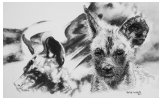
Out of the Shadows Charcoal on Canson Aquarelle, 46 x 68 cm