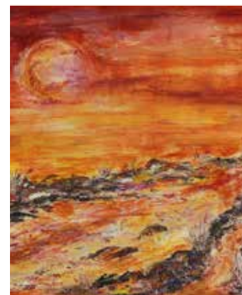
Okavango Träume Mischtechnik auf Leinwand, 100 x 100 cm