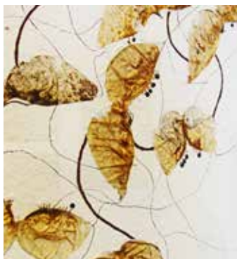
Dynamisch (Ausschnitt), Recyclingbüttlen, Blasenstrauch, Tusche, Original, 162 x 80 cm