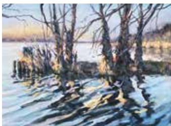
Auf dem Schwielowsee bei Caputh Öl auf Leinwand, 30 x 30 cm

... lebt in Caputh. Er studierte an der Hochschule für Bildende Künste in Hamburg Malerei. Er arbeitet heute als Filmregisseur und Drehbuchautor und ist Grimme-Preisträger. Ab 2017 betrieb er 5 Jahre das Projekt „Tagesskizzen“, bei dem über 1.800 Aquarellskizzen je nach Wirkungsstätte täglich plein air entstanden. Ein weiterer Schwerpunkt der Ausstellung sind seine Wandgemälde in Öl und Aquarell.