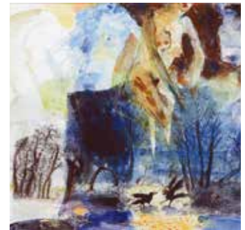
Frauen am See Collage Radierung Tusche, 70 x 100 cm