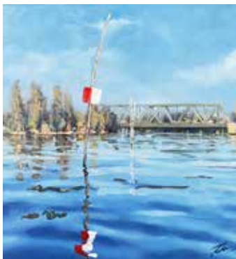
Auf dem Schwielowsee bei Caputh Öl auf Leinwand, 30 x 30 cm