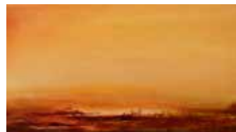
Morgenröte in der Namib Öl auf Leinwand, 80 x 40 cm