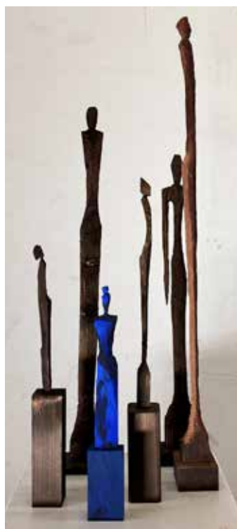
Begegnung Bronze, 20–120 cm