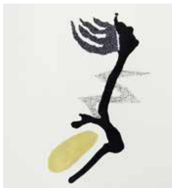
Linke Hand solo , Moorlake Fineliner und Papiercollage auf Aquarellpapier, 80 x 60 cm