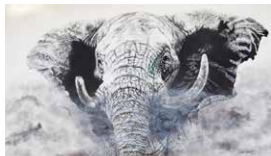
The Warning Charcoal on Canson Aquarelle, 70 x 125 cm