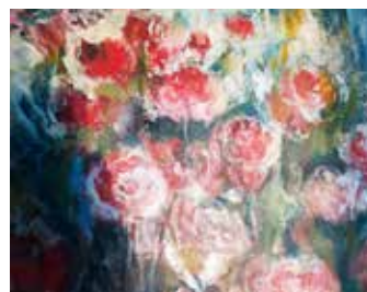
Rosenfeld Mischtechnik auf Leinwand, 100 x 100 cm

Im Mittelpunkt der Arbeit der studierten Bildhauerin und Grafikerin steht der Mensch auf der Suche nach Beständigkeit. Weder Instinkte noch Gesellschaftssysteme können sein Handeln in feste Bahnen lenken. Ordnung und Wandel bestimmen sein Leben. Körper, Bewegung und Raum spielen bei ihren Arbeiten eine besondere Rolle, somit vermittelt der Körper mit seiner Bewegung und seiner Position im Raum Inhalte.