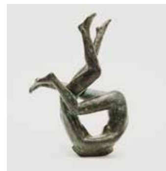
Taumel , Bronze, 16 cm