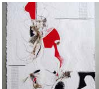
Smoldinski Las (Symposium Polen Horizont) 3 Tryptichon, Recyclingbüttlen Strandgut Acrylfarbe Tusche, 50 x 70 cm

Die gebürtige Stuttgarterin und studierte Psychotherapeutin beschäftigt sich in ihrer künstlerischen, mehrfach ausgezeichneten Arbeit mit dem Spannungsfeld zwischen Mensch und Natur, mit Umwandlung als Prinzip und Resultat von Neuschöpfung. Die hochgeschätzte Künstlerin arbeitet mit verschiedensten Materialien, die zu Reihen und Serien zusammengefasst und durch Zeichnung ergänzt werden.