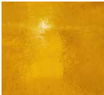
Verkündigung Öl auf Leinwand, 35 x 55 cm