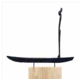
Seelenreisende Bronze blau patiniert, 47 x 40 cm