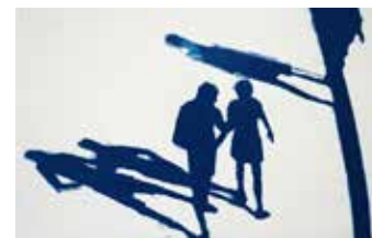
Passanten , Cyanotypie