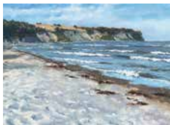
Strand bei Göhren Öl auf Leinwand, 40 x 60 cm