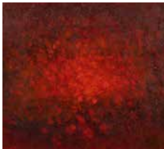
Roter Mohn Öl auf Leinwand, 40 x 50 cm