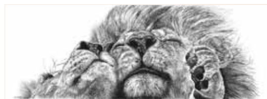
The Ecstasy Charcoal on Canson Aquarelle, 42 x 120 cm

... lebt in Südafrika. Mit ihrer Arbeit will sie die zerstörerische Gier des Menschen, die afrikanische Natur zu kommerzialisieren und die Gefahren für Natur und Tierwelt sichtbar machen. Die Bildsprache ihrer monochromen Holzkohle-Zeichnungen schärft den Blick auf die Tiere und ihr Schicksal. Sie konfrontieren und fesseln. Die Perspektive des Betrachters ändert sich von desinteressierter Apathie zu Betroffenheit.