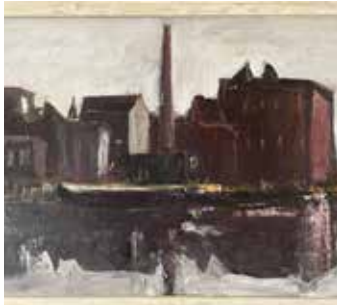
Altes Gaswerk Öl auf Leinwand, 60 x 90 cm