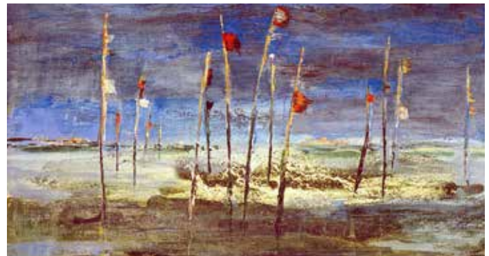
Wasserzeichen Farbradierung, 50 x 65 cm