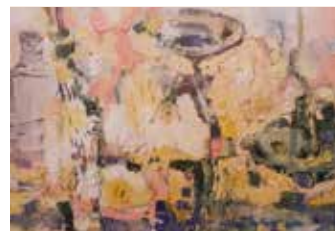
Stilleben abstrakt Mischtechnik auf Leinwand, 40 x 120 cm