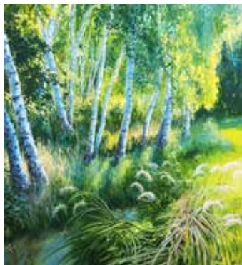
Wassergaben mit Birkengruppe Öl auf Leinwand, 160 x 120 cm