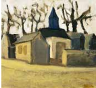
Kirche in Märkisch Wilmersdorf Öl auf Leinwand, 51 x 61 cm